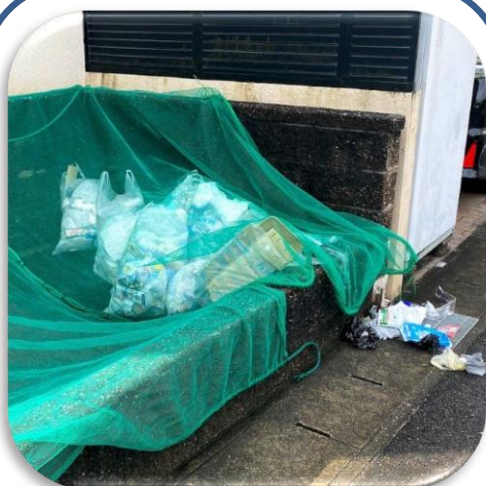
手前のゴミは荒らされがち

行政区内を回ってみるとゴミのマナーもまちまちで、ステーションの奥からゴミを置くことと、ネットをしっかりとかぶせること、しかもゴミ袋にネットが触れないようにすることの3つがポイントになるようです。