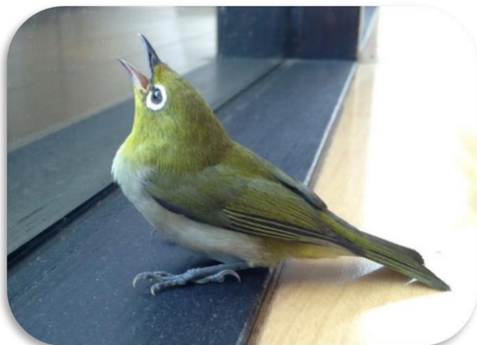
ひばりヶ丘に飛来する「メジロ」

まずは「メジロ」です。スズメくらいの大きさで全体に黄緑色の羽に目の周囲が白く輪になっているのが特徴。写真は以前梅雨頃に我が家に飛び込んできたメジロです。慌てて窓ガラスにぶつかって少しポーっとしています。しばらくしたら元気に飛んでいきましたのでご安心を。