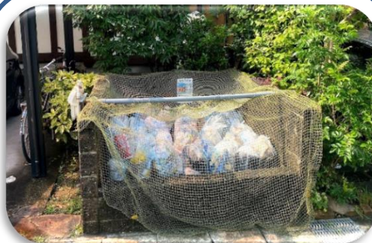
横バーでゴミ袋から距離をとりゴミ袋もしっかり奥まで入れてあります