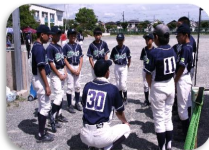
試合前に監督さんと戦略の確認

試合は緑ヶ丘小学校で行われ、対戦相手は「ふれあいカップ」の同じブロックで予選リーグを戦う「隼 Guardians (岡崎)」でした。当日は35℃に迫る炎天下でしたが、大きな掛け声で元気にプレーした緑ヶ丘ウイングスが、大技小技を絡めたそつない攻撃と、堅い守りで17対2で快勝！