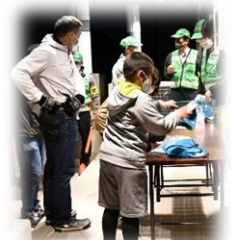
受付、準備を整えて

新型コロナウイルスの感染拡大を受けて中止が続いていましたが、本年度初となる防犯パトロールを11月5日（金）20：00より実施しました。子ども隊、緑丘ウィングスの仲間、ひばり会、行政区役員あわせて総勢33人のパトロール隊を2班に分けて大きな声で注意を呼びかけながら練り歩きました。