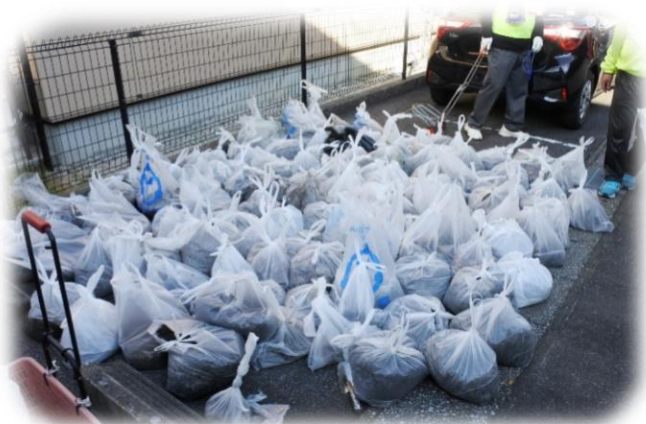
沢山の泥・土を除去!