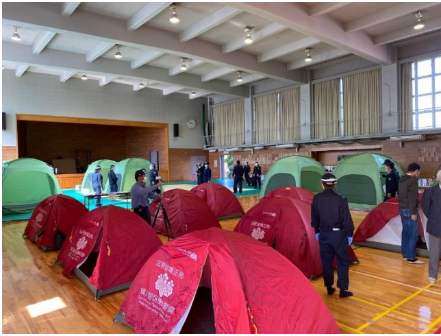
一人用の赤いテント