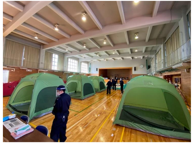
家族用の緑のテント