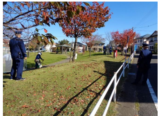
※受刑者の承諾を得て掲載しています

今後とも、1丁目の公道際の除草を含めて頻度は多くないものの通年で実施されますので御承知おきください。