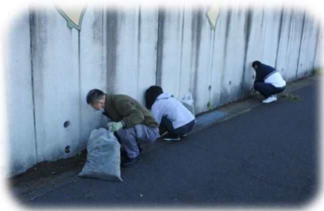
コンクリート壁際も綺麗に!