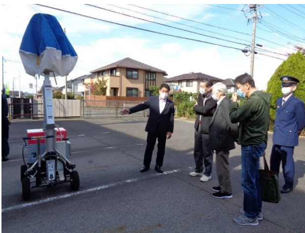
説明を受ける行政区三役

武道場の中は、家族・託児者、男性、女性のゾーンに区分けされ、一人用・家族用テントが配置されていました。また、トイレ、浴室、授乳室、更衣室、発熱隔離室や段ボールによる組み立てベッドも用意されていました。