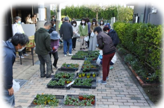
お茶と花苗をお持ち帰りいただきました