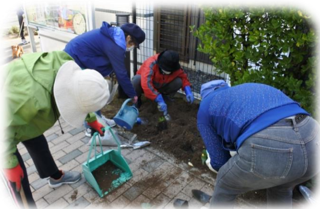
ひばり会の皆さんにふれあいセンター回りの植栽をしていただきました