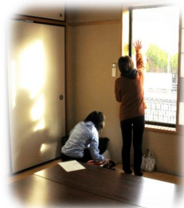
子どもたちにひばりヶ丘公園の清掃をしていただきました