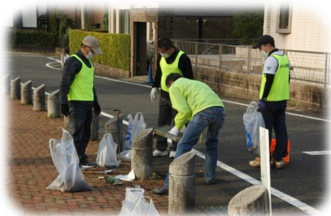
側溝の泥・土除去は大変でした