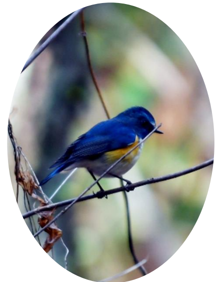
三好丘緑地にて「ルリビタキ」