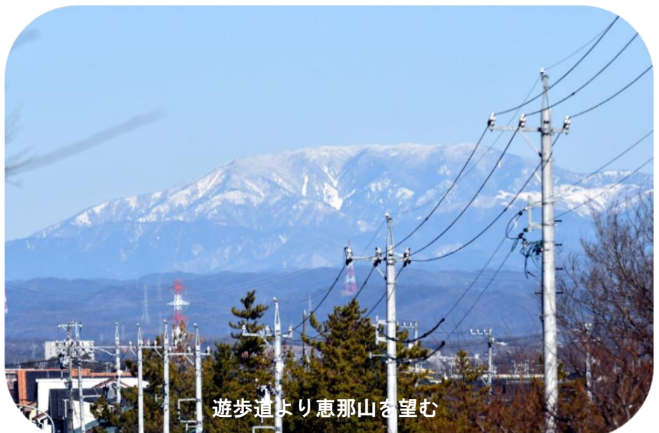
遊歩道より恵那山を望む