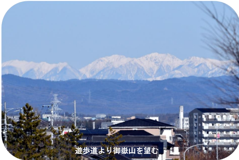
遊歩道より御嶽山を望む