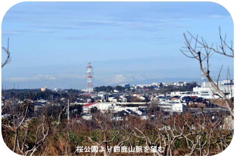
桜公園より鈴鹿山脈を望む