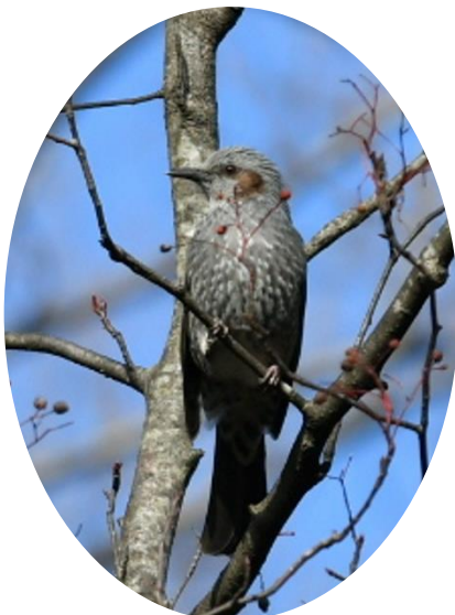
三好丘緑地にて「ヒヨドリ」